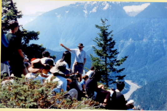
Des élèves apprenant l'histoire de la Colombie-Britannique à partir d'un point avantageux sur la route des brigades des pelleteries de HBC dans le canyon du Fraser.