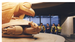
Raven and First Humans, MOA

La réouverture partielle du MOA au public a eu lieu le dimanche 8 mars après plus de six mois de rénovations, incluant des mises à niveau de l'enveloppe du bâtiment et des systèmes environnementaux. Les Multiversity Galleries (anciennement Visible Storage) et les galeries abritant les grandes expositions temporaires resteront fermées jusqu'à la réouverture complète du musée, le 23 janvier 2010, date qui coïncide avec l'ouverture de l'Olympiade culturelle de Vancouver qui se tiendra du 22 janvier au 31 mars 2010. www.moa.ubc.ca