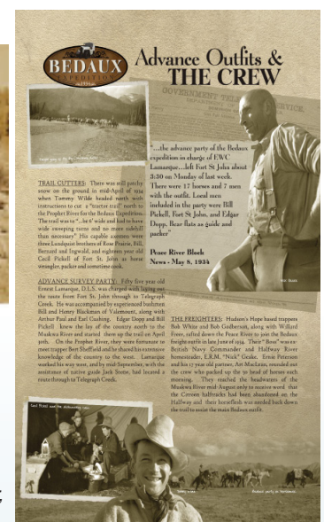
Panneau de Horses, Horsepower, and Horsing Around